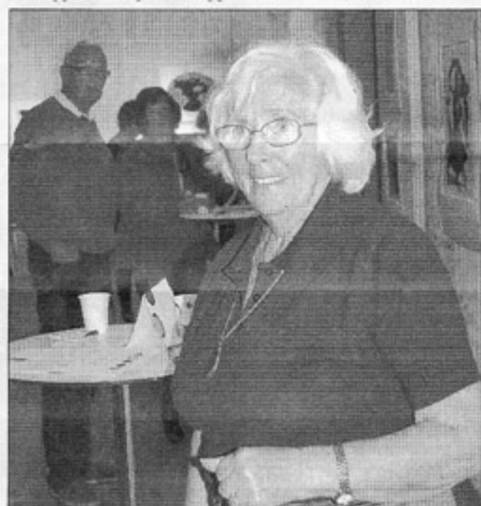
I pausen fanns cirkelledare från Studieförbundet Vuxenskolan på plats och berättade om olika aktiviteter som arrangeras.